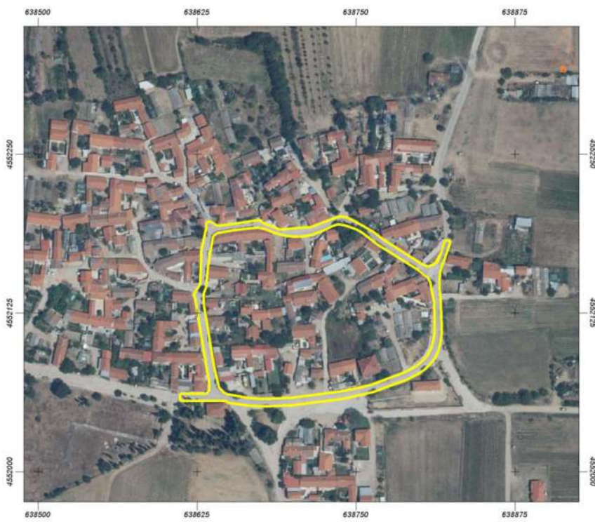
Δελινά ( Τμήμα Ι: 2.126,85 μ2 και Τμήμα ΙΙ: 1.581,07 μ2)