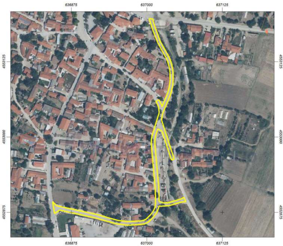
Φύλλα (Τμήμα Ι: 3.679,31 μ2)