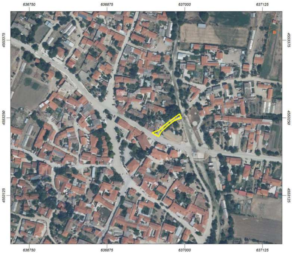
Φιλύρα (Τμήμα IV: 255,78 μ2)