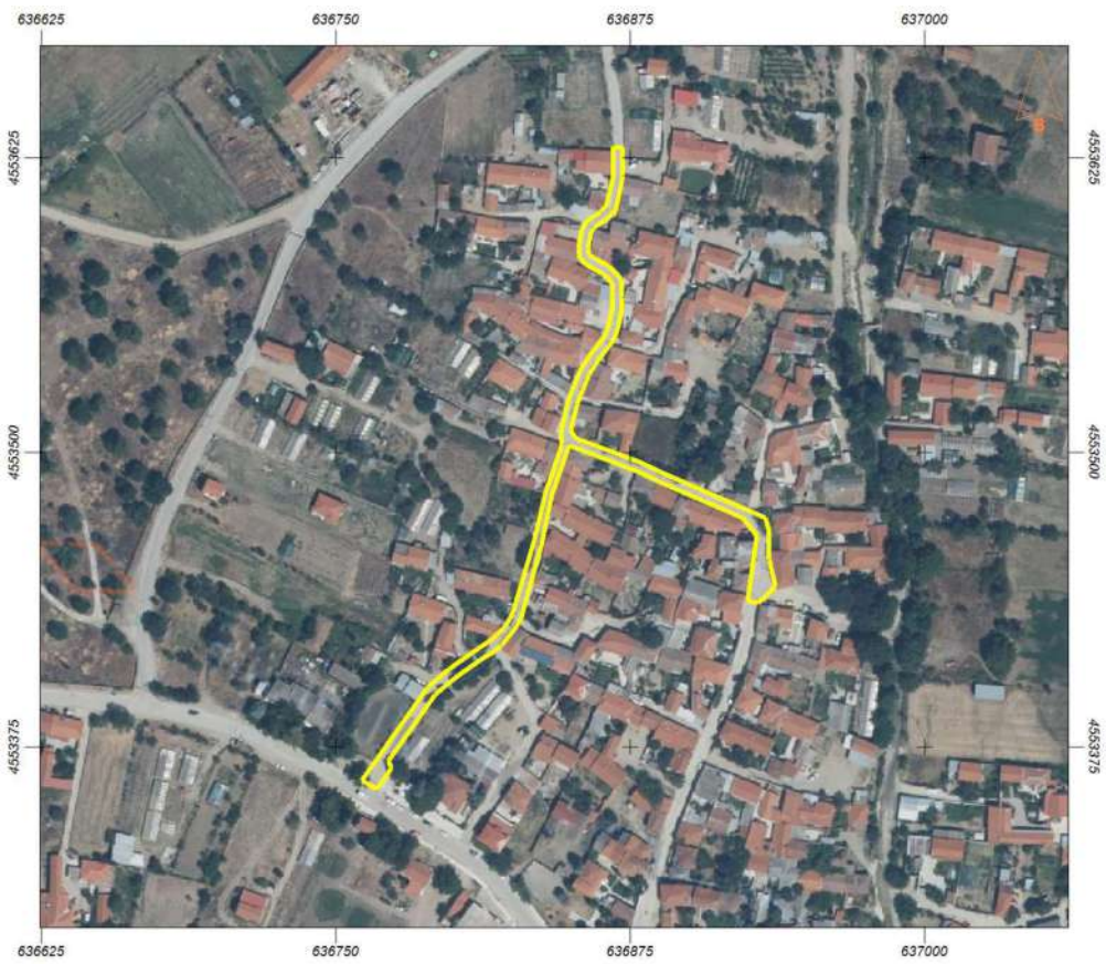
Φιλύρα (Τμήμα III: 1.906,37 μ2)