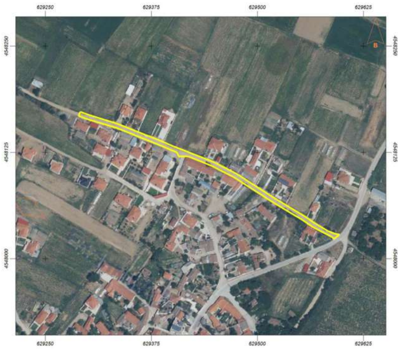
Αρχοντικά (1.701,79 μ2)