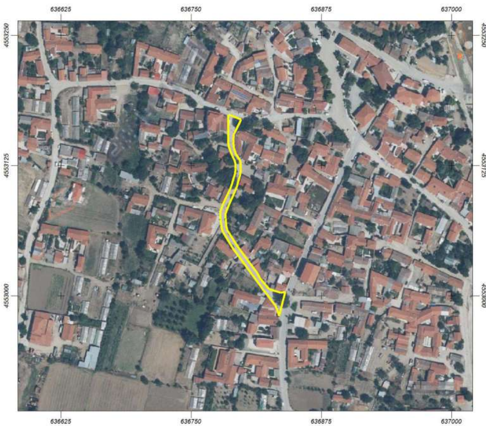
Φύλλα (Τμήμα ΙΙ: 1.176,82 μ2)